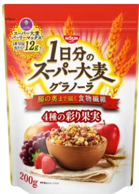
1日分の スーパー大麦グラノーラ 4種の彩り果実