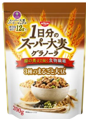
1日分の スーパー大麦グラノーラ 3種のまるごと大豆