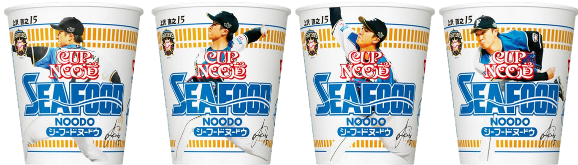
上沢 直之選手（カップヌードル シーフードヌードル 北海道限定パッケージ）