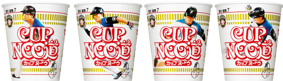
西川 遥輝選手（カップヌードル 北海道限定パッケージ）

パッケージデザイン：北海道にちなみ、ブランドロゴ「CUP NOODLE」の“DLE”を“道”に置き換え、北海道日本ハムファイターズの西川 遥輝選手、近藤 健介選手、上沢 直之選手をカップにデザインしました。選手ごとに4種類のデザインを用意し、集めて並べると躍動感あふれる走塁フォーム、バッティングフォーム、ピッチングフォームの動きが完成します。