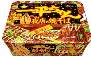
明星 一平ちゃん夜店の焼そば