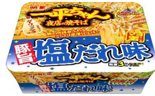
明星 一平ちゃん夜店の焼そば 豚旨塩だれ味