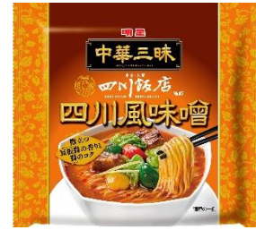
明星 中華三味 四川飯店 四川風味噌