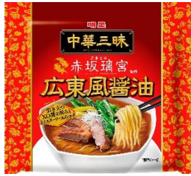
明星 中華三味 赤坂璃宮 広東風醤油