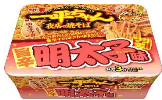
明星 一平ちゃん夜店の焼そば 旨辛明太子味