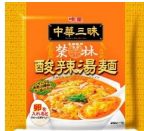
明星 中華三味 赤坂榮林 酸辣湯麵