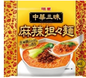
明星 中華三味 麻辣担々麵