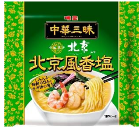
明星 中華三味 中國料理北京 北京風香塩