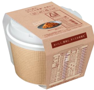
All-in PASTA 粗挽き牛肉の旨み あふれる濃厚ボロネーゼ