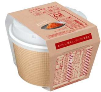
All-in PASTA 真っ赤なトマトの スパイシーアラビアータ