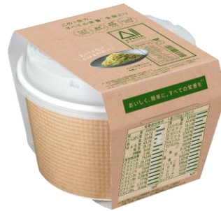
All-in PASTA バジルが香り立つ 本格ジェノベーゼ